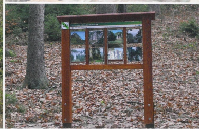
Interaktivní informační tabule