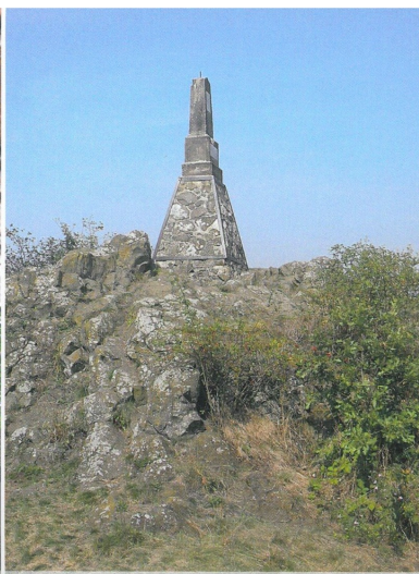
Památník na vrchu Mužský