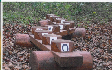
Herní prvek naučné stezky