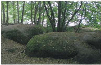
Přírodní rezervace Příhrazské skály