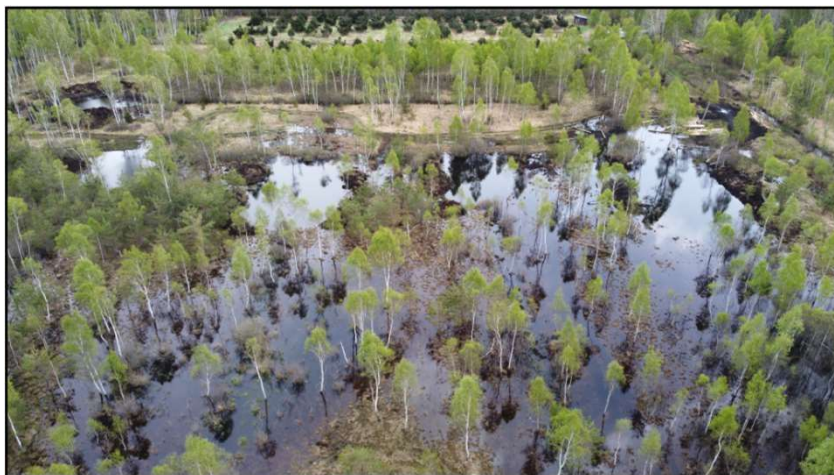
Rašeliniště Borkovická blata (Veselí n. Luž.)