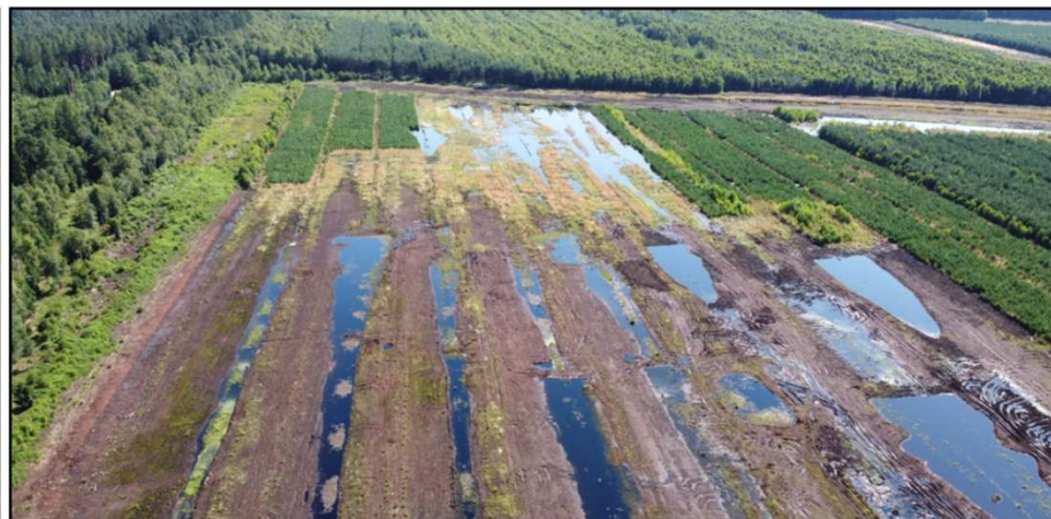
Rašeliniště Hrdlořezy (Suchdol n. Lužnicí)